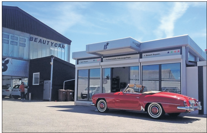
Die Beautycar-Experten machen ihr Auto schön.

Auf der Webseite und auf Facebook können sich jetzt die umsehen, die mit ihrem Auto noch nicht vorgefahren sind, denn die Reparaturen von Karosserie- und Lackschäden sind nur ein Bereich der breit gefächerten Dienstleistungspalette von Beautycar Mannheim. Die umfassenden Leistungen werden für alle Typen von Fahrzeugen angeboten, für Klassiker und Oldtimer, Cabrios