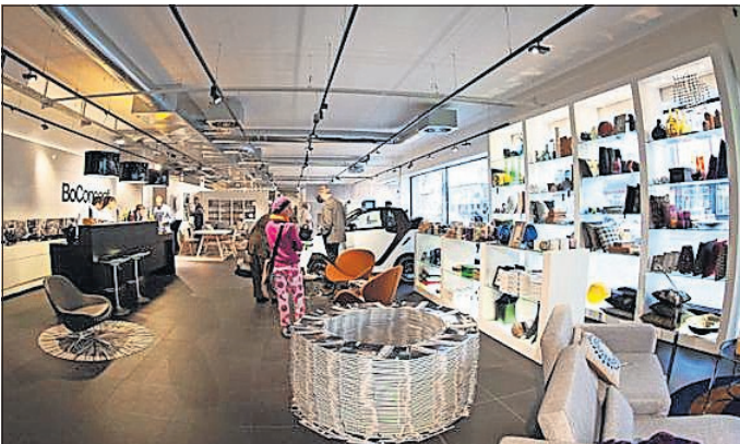
Der Mannheimer BoConcept Store bietet auf 700 Quadratmeter Ausstellungsfläche eine große Auswahl dänischer Designmöbel und ein breites Angebot an modernen Wohnaccessoires.

Der Mannheimer BoConcept Store bietet auf 700 Quadratmeter Ausstellungsfläche eine große Auswahl dänischer Designmöbel für die Bereiche Wohnen, Essen, Schlafen und Arbeiten, abgerundet durch ein breites Angebot an modernen Wohnaccessoires. Für alle Fragen rund um das Thema Einrichtung stehen die BoConcept-Designberater im Store, aber auch beim Kunden zuhause, zur Verfügung. Bei diesen Hausbesuchen mit dem Namen „BoConcept